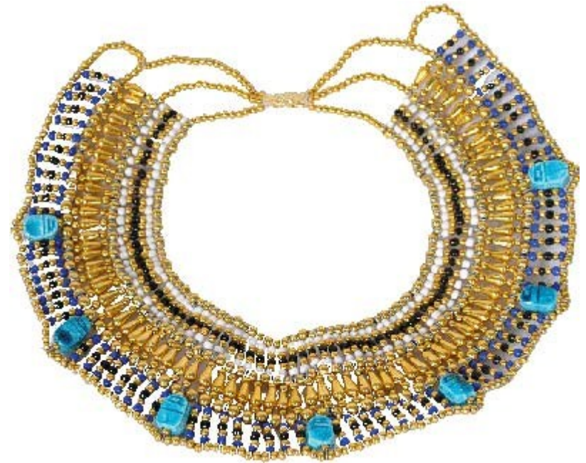
زیورآلات مصر باستان